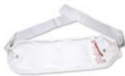
THERMOFORM Paraffinkompreße mit 2 Bändern für Hals und Gelenke 10 x 30 cm # 1040