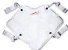
THERMOFORM Paraffinkompreße mit 4 Bändern für den Schulterbereich # 1050