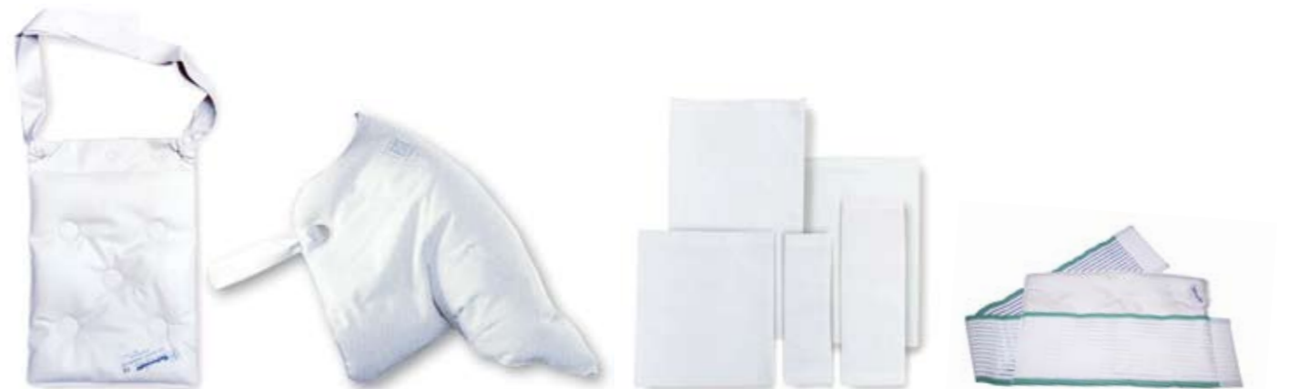
THERMOFORM Eiskomresse mit 2 Bändern für Arm- und Beinbehandlung 24 x 32 cm # 1160