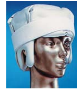
THERMOFORM IceCap mit Klettband # 1181