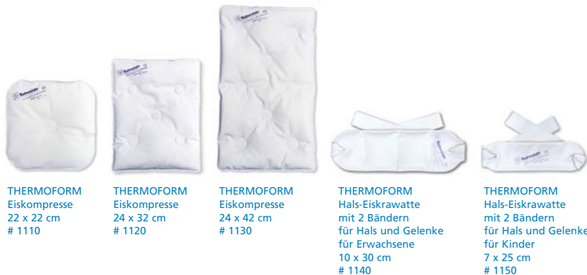
THERMOFORM Eiskomresse 22 x 22 cm # 1110