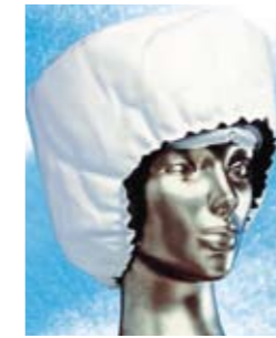
THERMOFORM IceCap Set mit Klettband und Isolierhaube # 1180

Die THERMOFORM IceCaps haben eine anatomische Passform für alle Kopfgrößen.